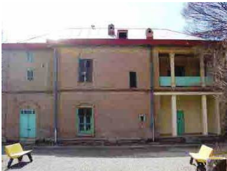
احمد آباد - آرامگاه دکتر محمد مصدق

آنچه همگان، اعم از مرد و زن ایرانی در باره مصدق می دانیم این است که او برای تغییر و تحول تدریجی در ساختارهای اقتصادی، اجتماعی، فرهنگی و سیاسی ایران، صاحب یک مکتب فکری تاریخی بود. وی بر اساس تز " موازنه منفی " عمل می کرد که قرنهاست در ادب و فلسفه و هنر ایرانیان پرداخته شده بود. از دید مصدق عمل به این اندیشه، یعنی بسط و گسترش مردمسالاری در جامعه ملی ایران بر اصول آزادی، استقلال و رشد در عدالت. او در آخرین دفاعیه اش، بزرگترین جرم خود را عمل بر اساس همین اندیشه می داند زیرا وی تلاش کرد به جامعه ملی نشان دهد می تواند از زیر بار سلطه خارج شود بدون اینکه سلطه گر شود. او هدف خود برای خارج کردن سلطه گران خارجی از کشور و حاکم گرداندن مردم بر مقدرات خود را این چنین عنوان می کند: "می خواهم از روی حقیقتی پرده بردارم ... این اولین بار است که يك نخست وزیر قانونی را به حبس و بند می کشند... چرا؟ برای من خوب روشن است. می خواهم طبقه جوان مملکت که چشم و چراغ و مایه امید مملکت هستند، علت این شدت عمل را بدانند و از راهی که برای طرد نفوذ استعمار بیگانگان پیش گرفته اند منحرف نشوند و از مشکلاتی که در پیش دارند نهراسند و از راه حق و حقیقت باز نمانند. به من گناهان زیادی نسبت داده اند ولی من خودم می دانم که يك گناه بیشتر ندارم و آن این است که تسلیم خارجی ها نشده و دست آنها را از منابع طبیعی ایران کوتاه کرده ام و در تمام مدت زمامداری، يك هدف داشتم و آن این بود که ملت ایران بر مقدرات خود مسلط شود و هیچ عاملی جز اینکه ملت در تعیین سرنوشت مملکت دخالت کند نداشتم ". (۴)