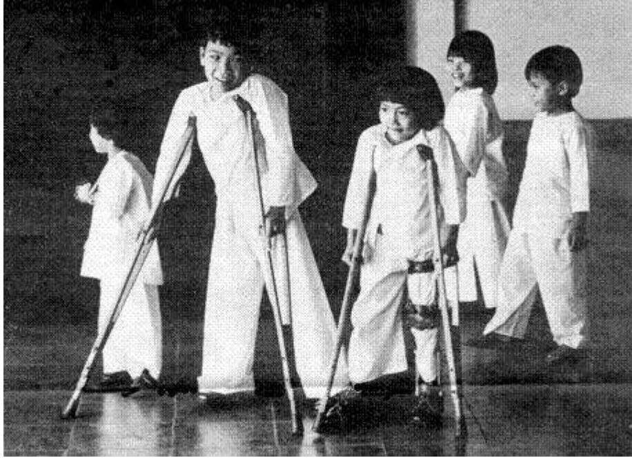
Victims of Agent Orange on crutches.