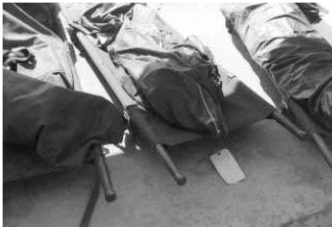
At the end also Americans could find their