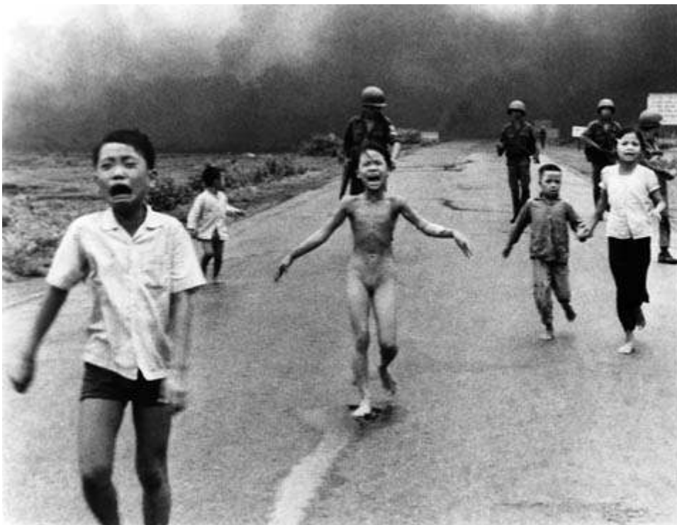
After Napalm bombing of the whole village people fly from the heat and the massmurder of "USA". Huynh Cong (Nick) Ut, Trang Bang, 1972. http://www.amherst.edu/~mead/exhibitions/exhibits/painofwar/ (Juli 2005)

http://www.janmontyn.com/roles2.html (Juli 2005)