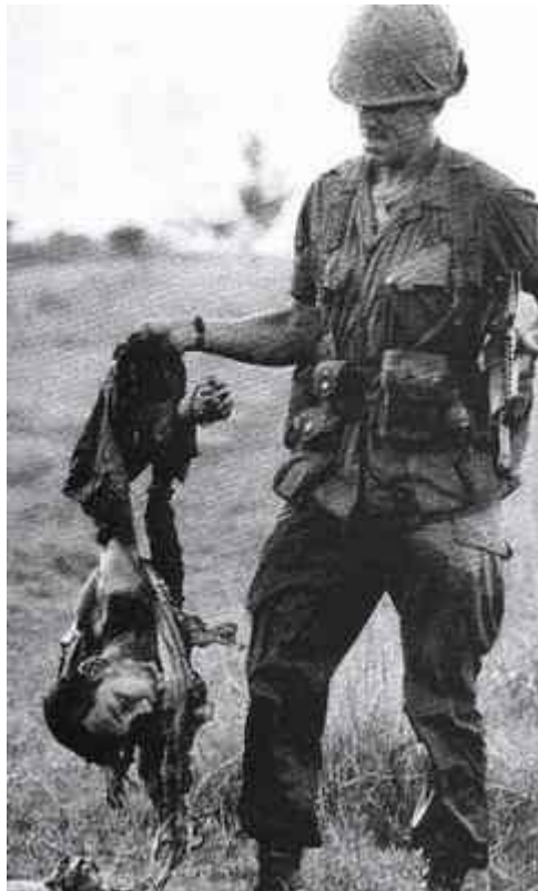
Picture of American soldier laughing historically at the charred remains of a VC soldier who was burned to death by a Napalm Bomb.

http://darping.tripod.com/darland/vietnam.html (Juli 2005)