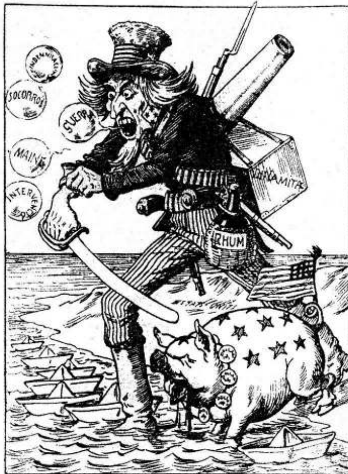
Amerika bereitet sich auf den Krieg vor: Eine Karikatur aus einer katalanischen Zeitung aus dem Jahr 1898. (Aus Sebastian Balfours «The End Of The Spanish Empire 1889–1923», Oxford 1997)

Amerika auf dem Weg zur Weltmacht; In: Neue Zürcher Zeitung, 25./26.4.1998, S.9