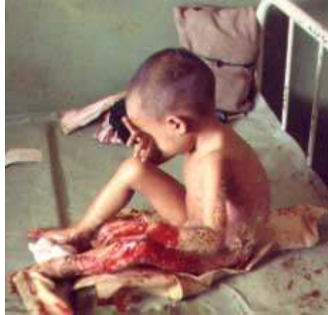
Vietnam War: half burnt Vietnamese child from Napalm bombs

http://darping.tripod.com/darland/vietnam.html (Juli 2005)