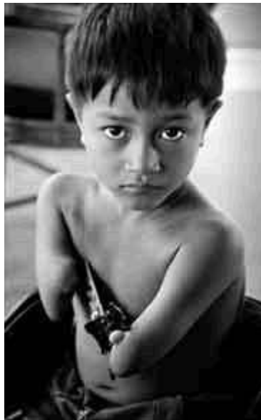
Foto from / von P.J.Griffiths; http://www.vn-agentorange.org/petition.html (Juli 2005)

Victim of Agent Orange with mutilated arms without hands.