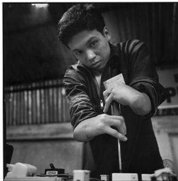
Victim of Agent Orange with mutilated hands.

Robert Kurz: Totalitäre Ökonomie und Paranoia des Terrors. Der Todestrieb der kapitalistischen Vernunft: http://www.nadir.org/nadir/periodika/contraste/robert_kurz.htm (Juli 2005)