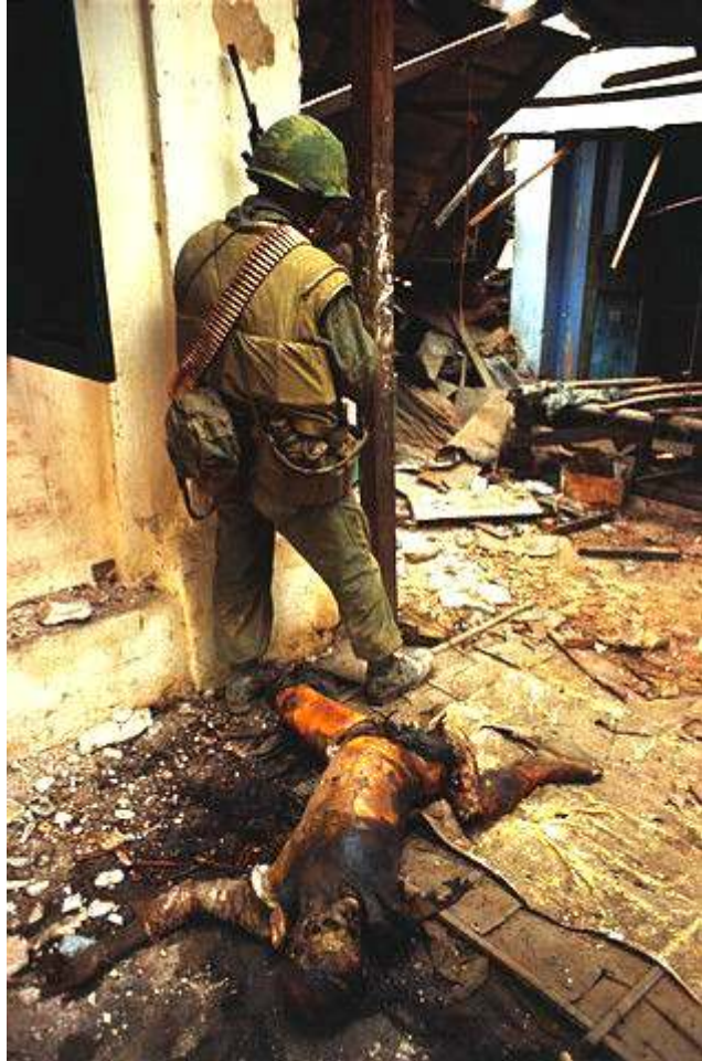
The charred remains of a Viet Cong soldier lie amid rubble in street where a U.S. Marine stands on the alert for further confrontations with Communist forces. Hue, South Vietnam, February 17, 1968. http://www.vietnampix.com/fire8b.htm (July 2005)