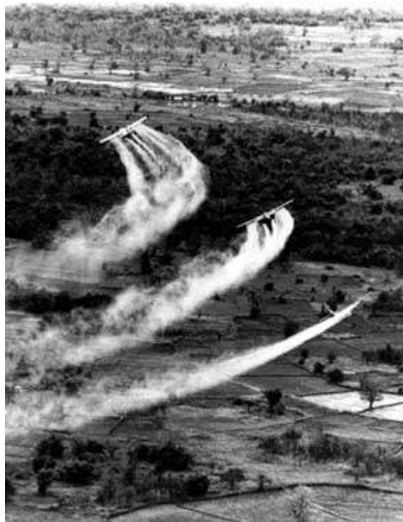
Agent Orange in Vietnam