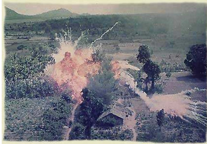
Destruction of a village by US Air Force napalm bombs.